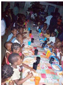
Foto do jantar que foi servido para aproximadamente 750 pessoas, quando grandes e pequenos, receberam uma refeição completa, e a maioria deles pela primeira vez na sua vida, pois no seu dia-a-dia, não tem acesso a carne, frango, arroz e feijão, numa só refeição. Estamos gratos a Deus por termos feito isso.

junto com o bolo da formatura. Apesar das muitas carencias e dificuldades locais, nós procuramos dar a eventos como esse o caráter mais formal possível, pois este é um dia único na vida deles.